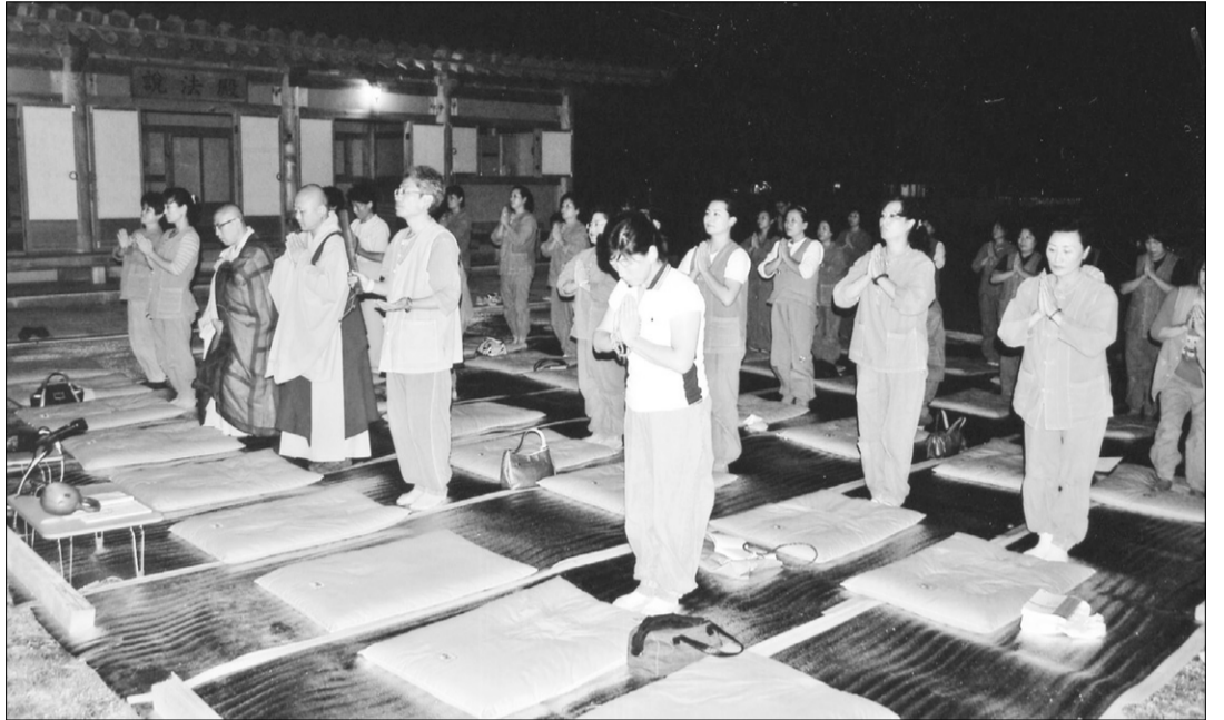
대한불교조계종 제3교구 건봉사 포교당이 2월28일까지 제2기 건봉사 불교대학 신입생을 모집한다. 사진은 지난해 실시한 불교대학 1기생들의 교육 모습.

한편 건봉사 포교당은 매월 양력 1일 오전 10시 인등법회를 열고, 매월 음력 18일에는 지장재