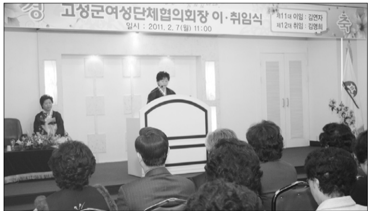
지난 7일 오전 11시 여성회관 3층 회의실에서 고성군여성단체협의회장 이·취임식이 열렸다.