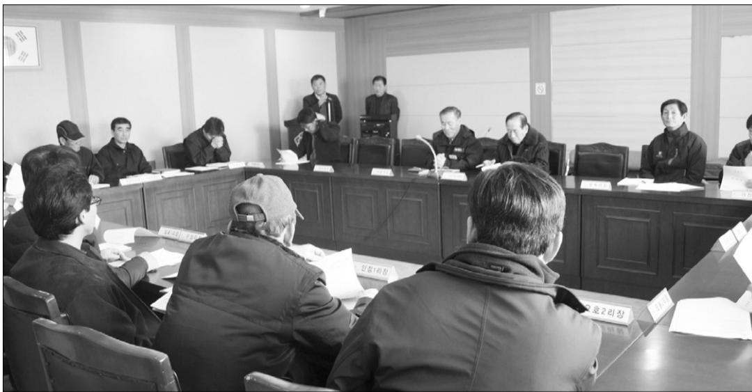
죽왕면사무소는 지난 18일 오전 11시 면사무소 2층 회의실에서 이장단회의를 개최하고 당면 현안사업들에 대해 논의했다.