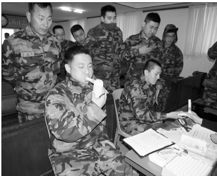
고성군보건소가 운영하는 군장병 대상 이동금연클리닉이 호응을 얻고 있다.