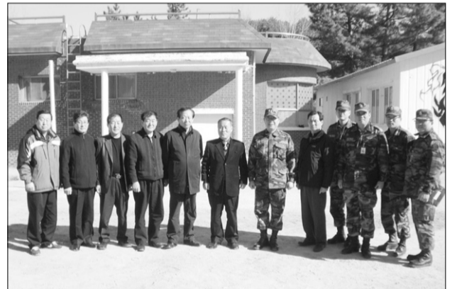
죽왕면변영회가 지난 1일 육군53연대 북진체육관 개관에 맞춰 탁구대와 탁구공 등 시가 70만원 상당의 운동기구를 전달해 민·군 유대강화에 앞장섰다.

지난 1일에는 육군53연대 북진체육관 개관에 맞춰 탁구대와 탁구공 등 시가 70만원 상당의 운동기구를 전달해 민군 유대강화에도 앞장서고 있다. 최광호 기자