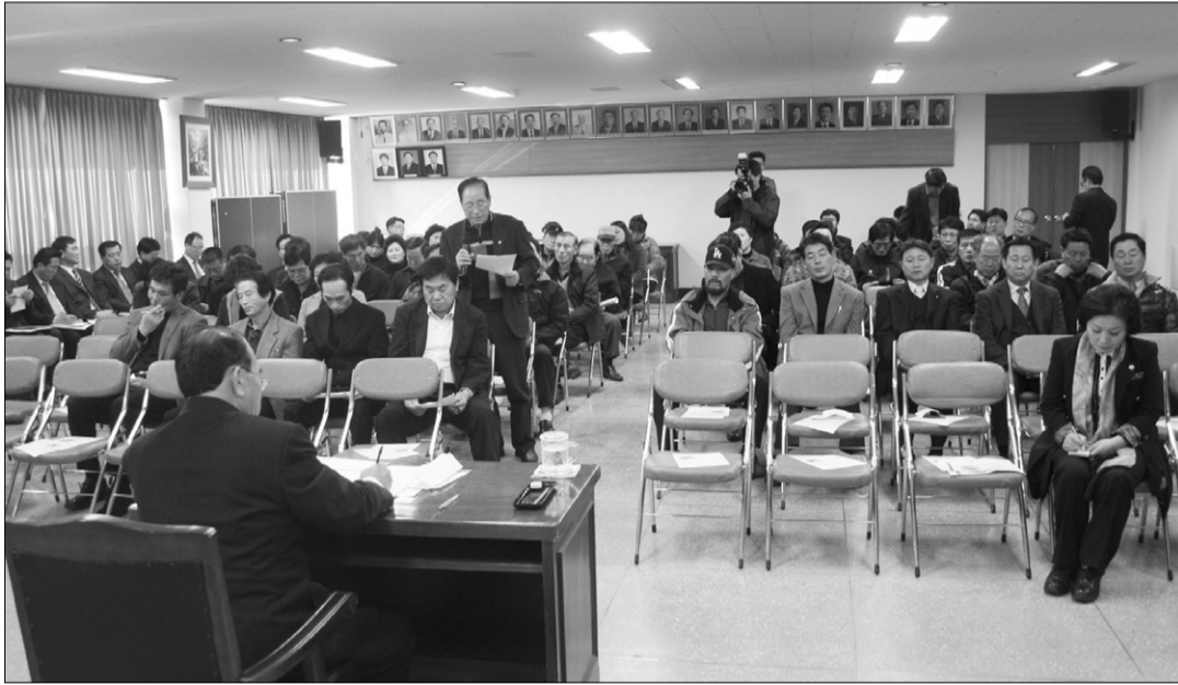
지난 22일 오후 2시30분 면사무소 2층 다목적실에서 2011년 죽왕면 연초순방 및 현안사항 청취 간담회가 열렸다.

※죽왕면에서 발생하는 아기자기한 소식이나 미담 등을 소개하는 시민기자를 모집합니다. (문의 : 681-1666)