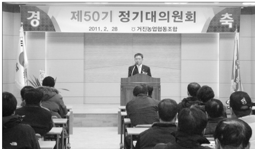
지난달 28일 거진농협 제50회 정기총회가 열렸다.

또 "농협 발전을 위해서 항상 열린 농정으로 여러분을 기다리고 있으며 '우리는 하나로 우리는 해낸다'는 생각으로