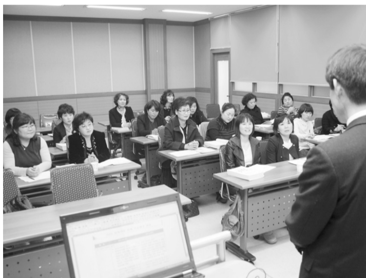
고성군은 지난 11일 평생학습관에서 관내 어린이집 등 보육시설을 대상으로 2011년 보육사업지침 및 재무회계규칙 교육을 실시했다.