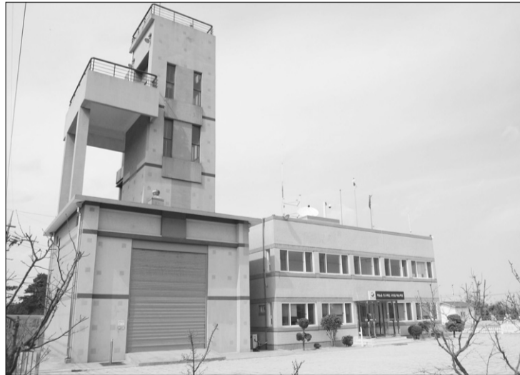
고성군 토성면 봉포리에 위치한 속초기상대 전경.

관 성과 평가에서 전국 35개 일반기상대 중 최우수(1위)를 기록했으며, 관측업무 종합실적에서도 기관 성과지표 전국 1위를 차지했다. 또 김남원 기상주