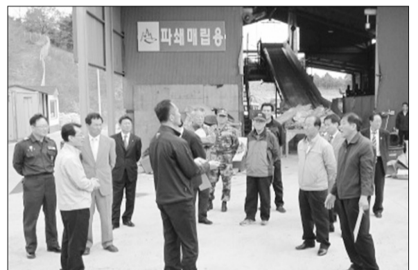
죽왕면 기관사회단체장 20여명이 지난달 29일 오전 11시 고성군 환경지원사업소를 찾아 쓰레기소각 및 재활용품 처리에 대한 현지 견학을 실시했다.