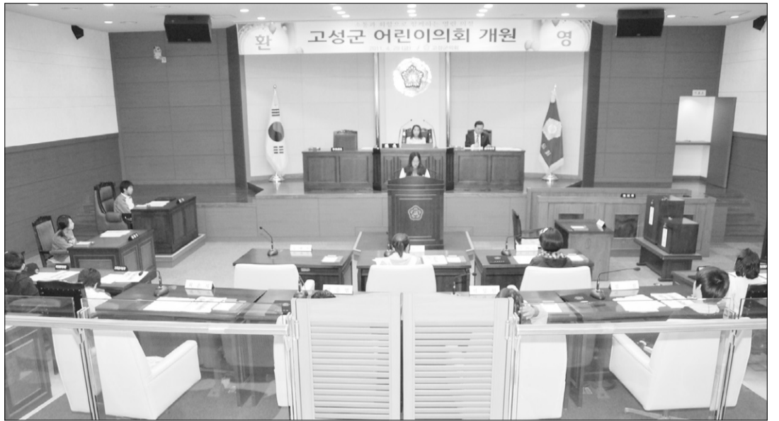
지난달 29일 오후 2시 고성군의회 본회의장에서 간성초등학교 어린이 4~6학년 학생들이 참석한 가운데 제1회 고성군 어린이의회 체험교실이 열렸다.