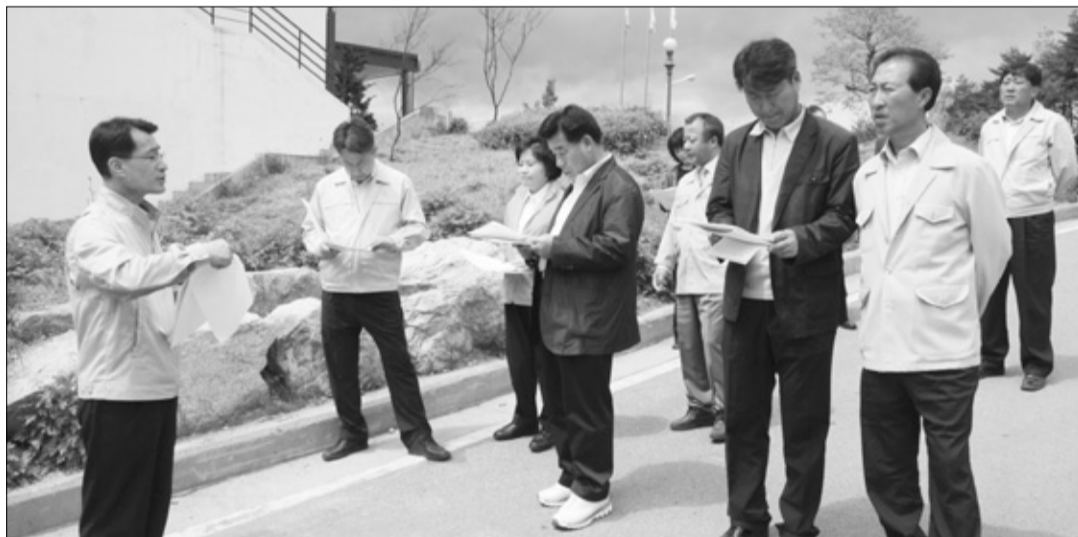
고성군의회 사업장 현지시찰 고성군의회는 지난 19일부터 25일까지 7일간의 일정으로 제212회 임시회를 열고, 주요 사업장 현지시찰 등의 활동을 벌이고 있다. 사진은 지난 20일 재활용품 선별 기간제근로자 사역장을 둘러보는 모습.