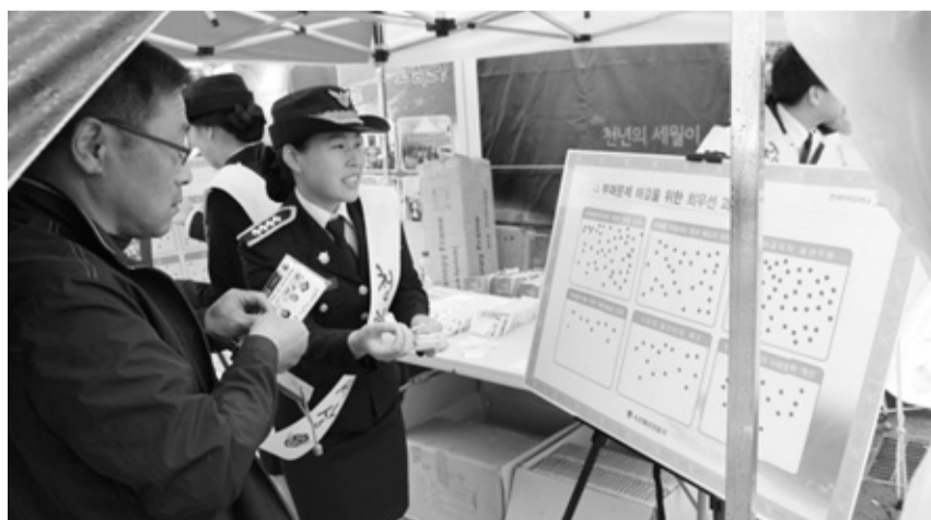
속초해양경찰서가 지난달 31일 화진포광장 일원에서 '청렴한 세상 캠페인'을 실시했다.

이날 캠페인에서는 '청렴 인식도 설문조사'와 '청렴 홍보물 배부'를 통해 부패의 정확한 의미와 신고를 해야 하는 부패행위들을 소개하고, 국민들의 신고를 적극 유도했다.