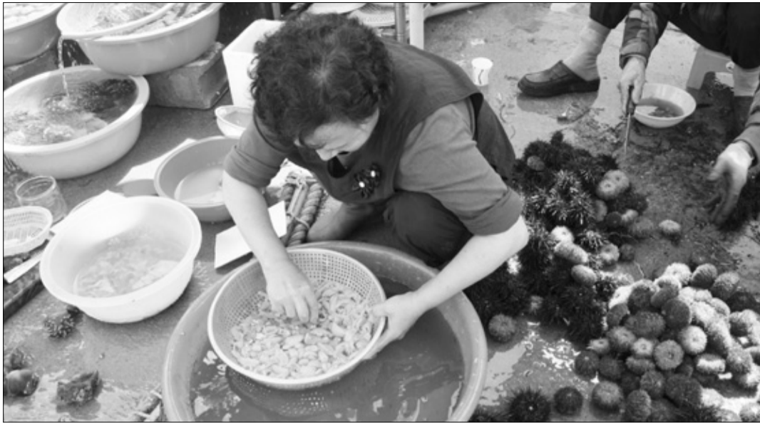
현내면 초도항일원에서 개최된 제6회 초도어촌체험마을 성게·바다축제가 지난달 28일부터 30일까지 성황리 개최됐다.