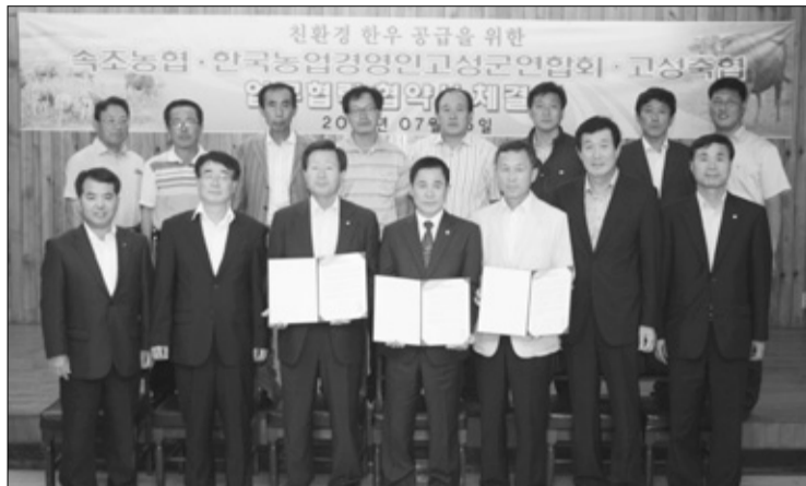
한국농업경영인 고성군연합회와 고성축협은 지난 15일 속초농협과 친환경 한우 공급추진 업무협력 협약식을 가졌다.

속초농협은 납품된 고성지역 한우를 속초농협 하나로마트 익스포점과 중앙시장점에서 판매한다.