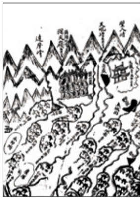
사진 왼쪽부터 울산바위 설경, 김홍도의 계조굴 그림, 간성군 지도(1897년).

대관령 동쪽 가닥이다. 기이한 봉우리가 꾸불꾸불하여 울타리를 설치한 것과 같으므로 이름 하였다. 세속에서는 울산(蔚山)이라고 전한다.” 향간에는 천후산과 울산바위가 서로 다른 의미로 보는 견해가 있다. 간성군지도(杆城郡地圖)에서 발견된 점과 대동여지도(大東輿地圖)에서 천후산과 울산을 별도로 표기하고 있다는 것이다.