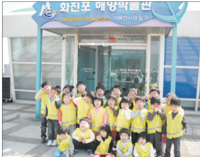
대진어린이집 원생들이 화진포 해양박물관을 관람했다.