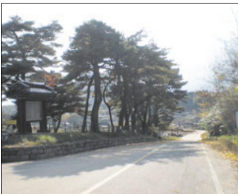
왕곡마을 입구에는 수령 150년이 넘는 소나무 10여 그루가 군락을 이루며 마을 수호신처럼 우뚝 서 있어, 이 마을이 범상치 않은 역사를 간직하고 있음을 말해준다.