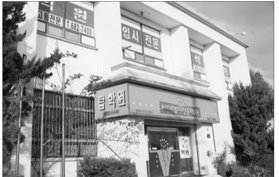
입시전문 수석학원 모습.

학원을 운영하면서 살핀 결과 똑똑하고 영특한 학생들이 많지만 부모님들이 생계 등의 어려움으로 학생 관리가 이뤄지지 못하는 것을 보았다”며 “공교육, 사교육, 도시, 시골 어떠한 여건·환경보다 학생들이 어