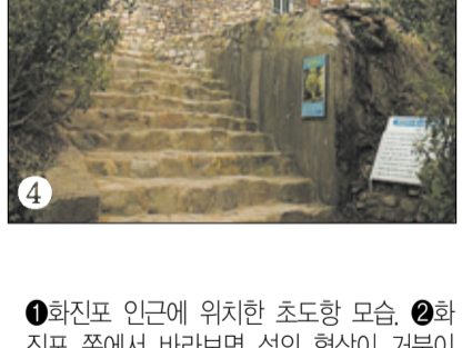
① 화진포 인근에 위치한 초도항 모습. ② 화진포 쪽에서 바라보면 섬의 형상이 거북이와 같이 보여 금구도(金龜島)라는 이름으로 불리는 섬. 광개토태왕릉이 금구도에 있다는 설이 있으나, 아직까지 명확하게 밝혀진 바는 없다. ③ 화진포 해양박물관. ④ 화진포의 성(김일성 별장) ⑤ 화진포 일대에 산재해 있는 고인돌. 화진포에는 청동기에서 철기시대에 이르는 선사 유적이 곳곳에 분포해 이 지역이 선사시대부터 인간의 중요한 생활터전이 되어왔음을 알 수 있다. 고인돌 유적은 아직 개발 진행 중인 관계로 가장 편하게 만나볼 수 있는 것이 ‘화포리 8호 고인돌’이다. 이 고인돌은 형태가 완전한 청동기 시대의 북방식 지석묘로 오가는 관광객들의 눈길을 끌고 있다.