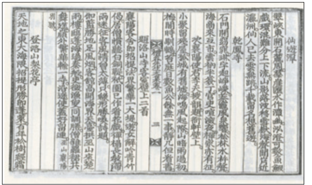
사진 왼쪽부터 이식의 택당집, 구음의 명곡집, 구문유의 예곡집.