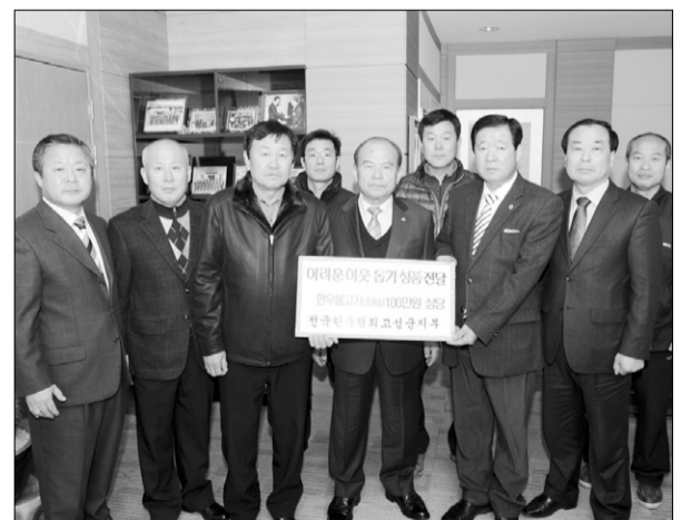
한우협회 고성군지부 관계자들이 지난 13일 황종국 군수에게 한우 불고기를 전달한 뒤 기념촬영을 하고 있다.

고성군은 이날 기탁받은 한우불고기를 읍면에 배정된 독거노인 및 저소득층 100명에게 전달, 어렵게 살아가는 소외계층에게 따뜻한 정을 나눠 모두가 훈훈하고 행복한 나눔의 분위기가 조성에 기여하기로 했다.