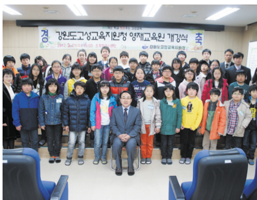
지난 21일 열린 고성교육지원청 영재교육원 개강식 참석자들이 기념촬영을 하고 있다.